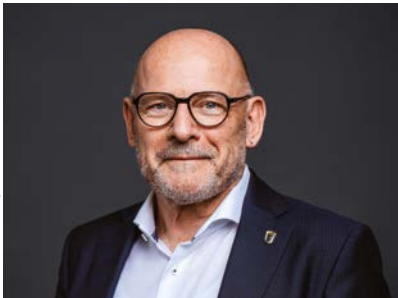
Winfried Hermann MdL, Minister für Verkehr des Landes Baden-Württemberg

Für das klimafreundliche Automobil der Zukunft „made in Baden-Württemberg“ müssen die Unternehmen des Landes im gesamten Automobilsektor bei der Softwareentwicklung zusammenarbeiten. Es ist zu teuer und macht auch keinen ökonomischen Sinn, dass jedes Unternehmen die Software komplett selbst entwickelt. Vom Open-Source-Ansatz können auch kleine und mittlere Unternehmen profitieren und darauf aufsetzen. Es wäre naiv, im internationalen Wettbewerb einzeln und ohne Kooperation den Erfolg zu suchen. Zudem zeigen wir mit diesem Weg auf, dass Softwareeinsatz und die Kriterien demokratischer Gesellschaften wie Beteiligung und Offenheit gut zueinander passen. Dadurch leisten wir einen Beitrag zu einem Europa, das selbstständig wettbewerbsfähige, technologische Lösungen hervorbringt.