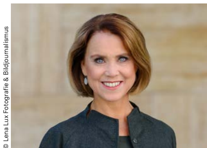
Petra Olschowski MdL, Ministerin für Wissenschaft, Forschung und Kunst des Landes Baden-Württemberg

Auch in der wissenschaftlichen Weiterbildung bieten die Hochschulen über 300 MINT-Weiterbildungen ( www.suedwissen.de ) an, die durch die Regional- und Fachvernetzenden in Zusammenarbeit mit der Wirtschaft weiterentwickelt werden.