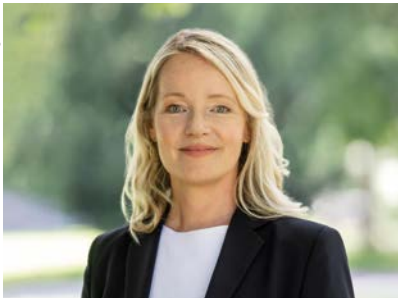
Thekla Walker MdL, Ministerin für Umwelt, Klima und Energiewirtschaft des Landes Baden- Württemberg

Im Sinne des Klimaschutzes muss die Transformation der Automobilwirtschaft ganzheitlich gedacht werden. Insbesondere schwere Nutzfahrzeuge müssen einen stärkeren Beitrag zur Dekarbonisierung des Verkehrssektors leisten. Der Aufbau der dazugehörigen Infrastruktur beinhaltet dabei große Herausforderungen. Es müssen flächendeckend Netzanschlüsse geschaffen und eine bedarfsgerechte Energieversorgung gewährleistet werden. Entsprechende Hemmnisse beim Aufbau von Ladeinfrastruktur für die Elektromobilität müssen abgebaut werden. Hierfür wird der Schwerpunkt Energie auch weiterhin einen wichtigen Beitrag innerhalb des Strategiedialogs Automobilwirtschaft Baden-Württemberg leisten.