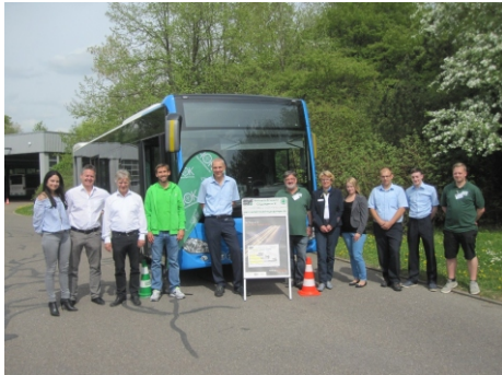
24. April 2018