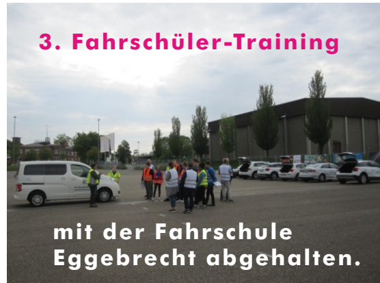
28. April 2018