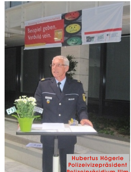
Hubertus Högerle Polizeivizepräsident Polizeipräsidium Ulm