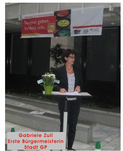
Gabriele Zull Erste Bürgermeisterin Stadt GP