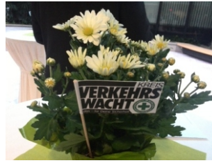
Rückschau auf die Feierstunde im Landratsamt