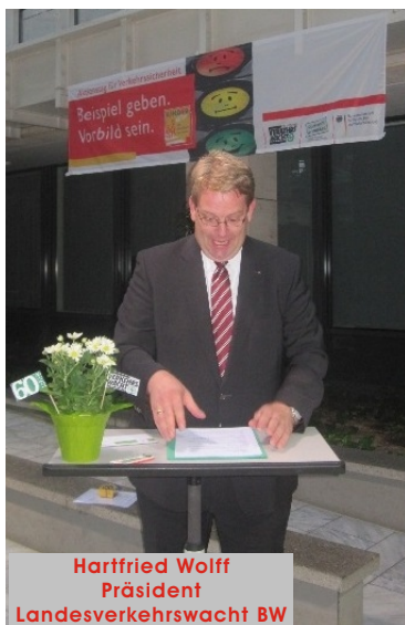
Hartfried Wolff Präsident Landesverkehrswacht BW